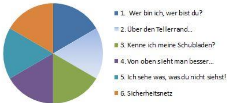
Abb. 1: Themensetzung der Webinar-Reihe

Wie der Titel der 3. Einheit suggeriert, sollte hierbei das „Schubladendenken“ bzw. die dahinterstehenden Stereotype und Vorurteile, die jede(r) von uns hat, bewusstgemacht werden.