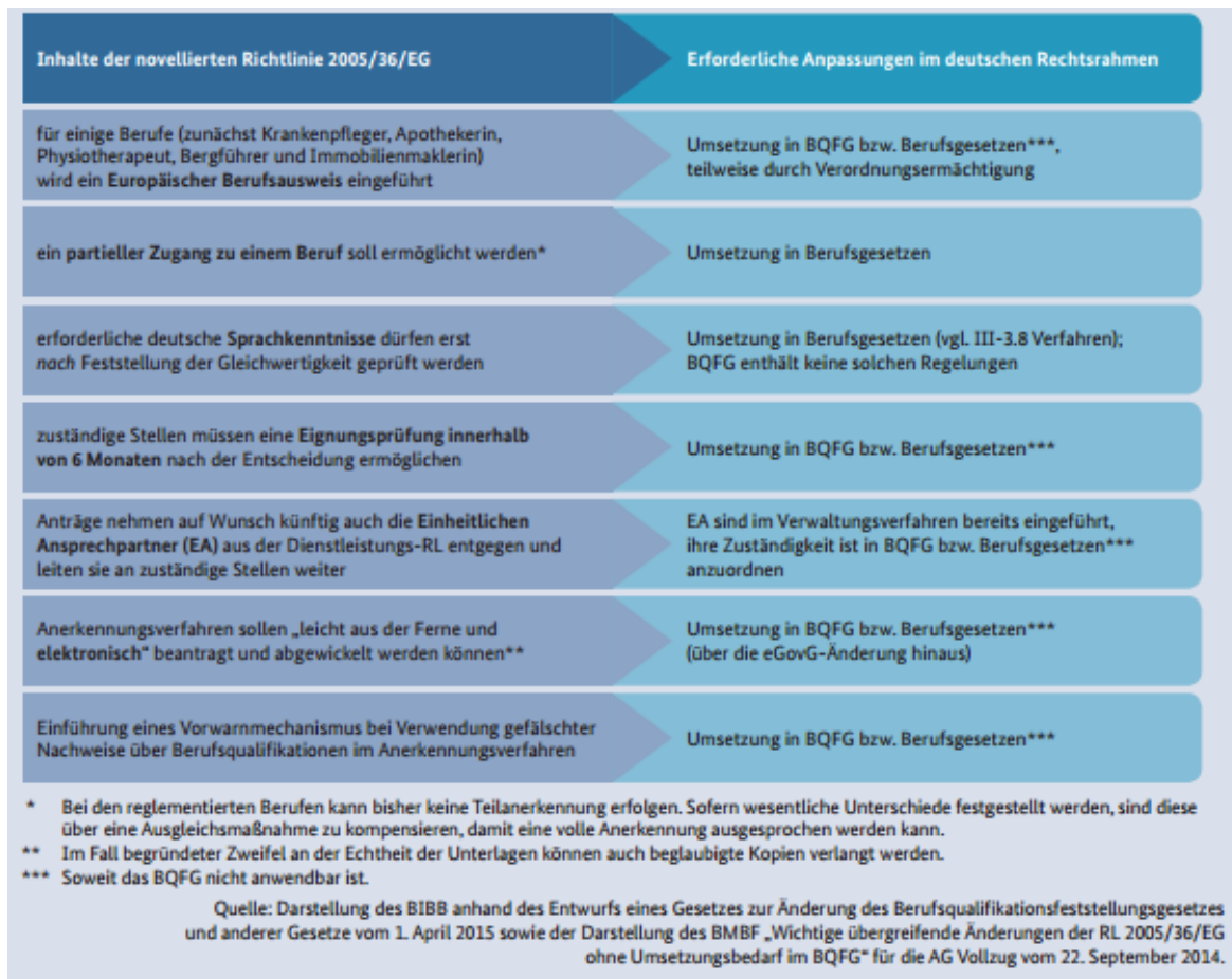
Abbildung 3: Änderungen infolge der novellierten EU-Berufsanerkennungsrichtlinie (BMBF, 2015, S. 40)